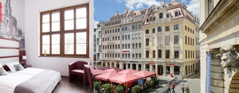
© Hendrik Meyer · Frank Grätz