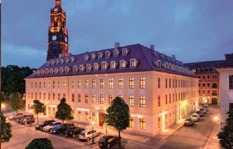
Hotel Bülow Palais