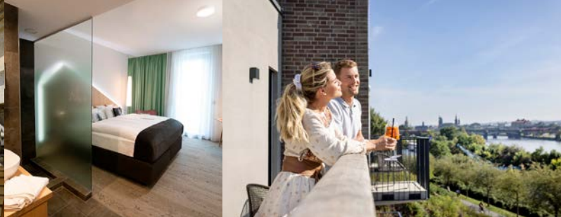
© Bjoern Franck · Harald Eisenberger